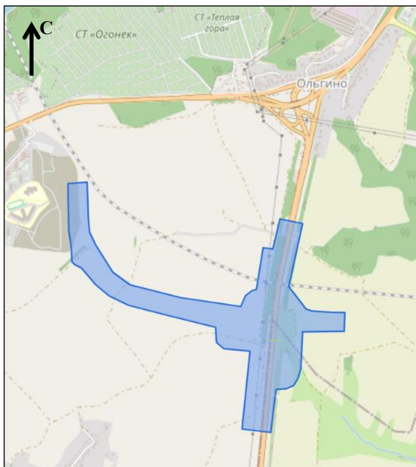
Схема границ подготовки документации по внесению изменений (арх. № 93/24)