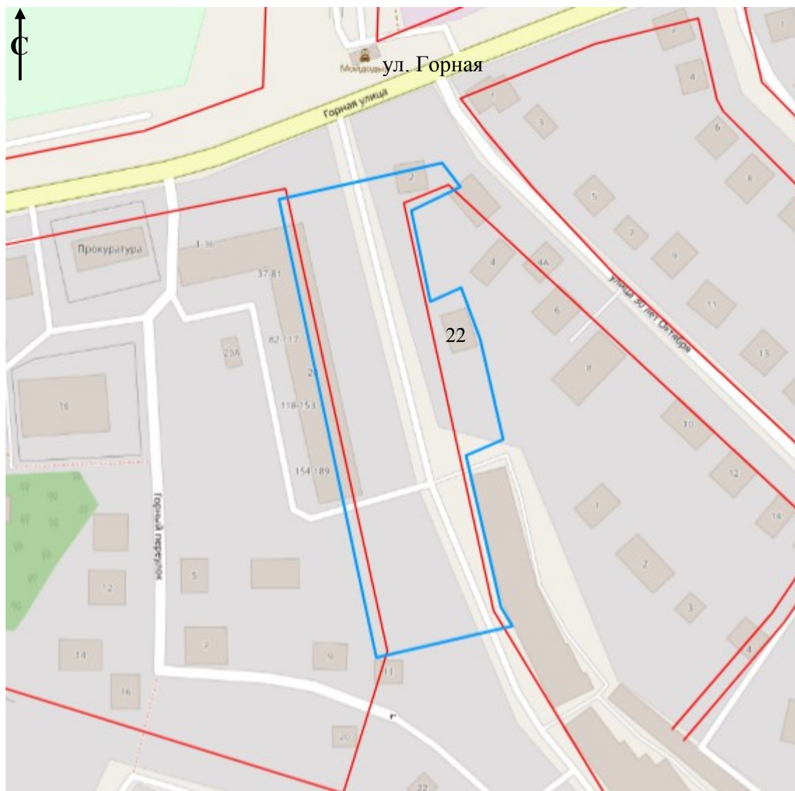
Схема границ подготовки проекта планировки территории (арх. № 101/24)