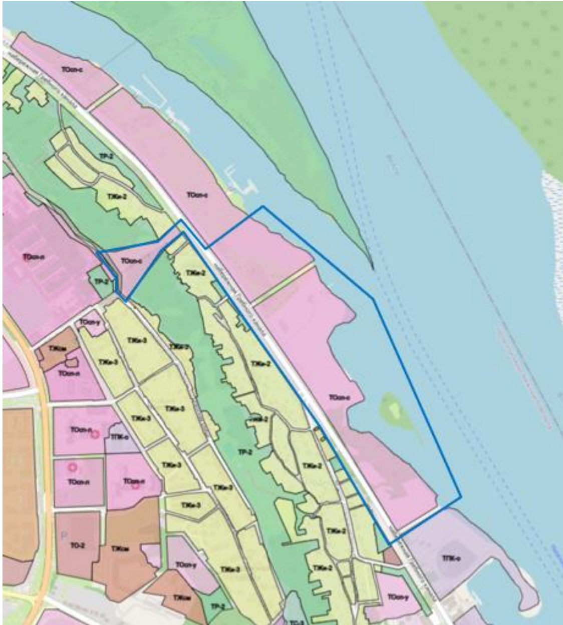
Схема границ подготовки документации по планировке территории