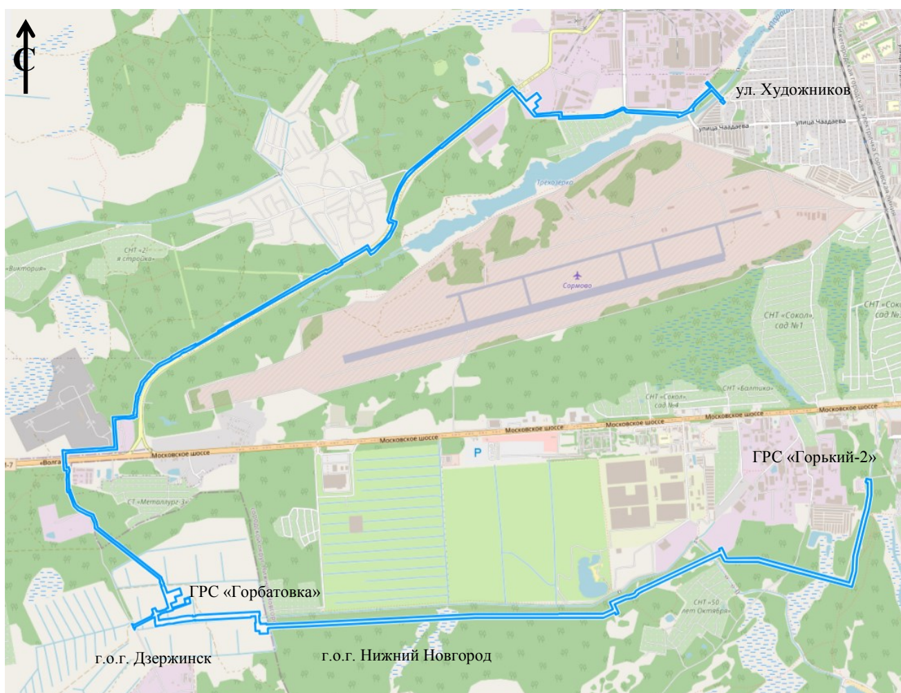
Схема границ подготовки документации по планировке территории (арх. № 45/24)