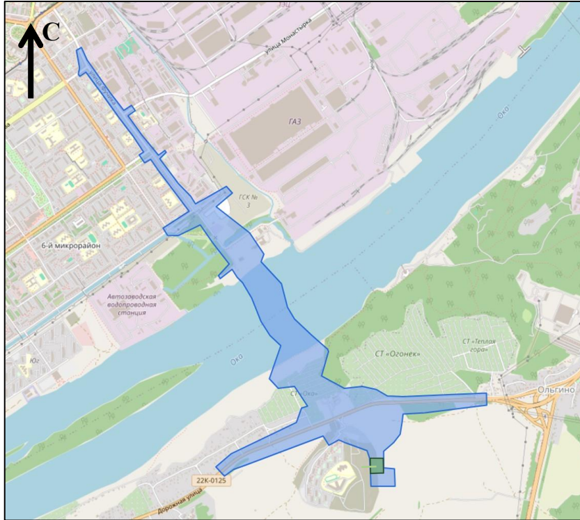
Схема границ подготовки документации по внесению изменений (арх. № 36/24)