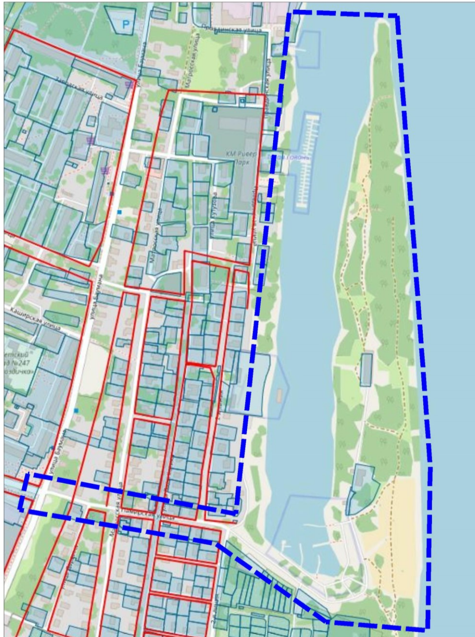
Схема границ подготовки документации по планировке территории