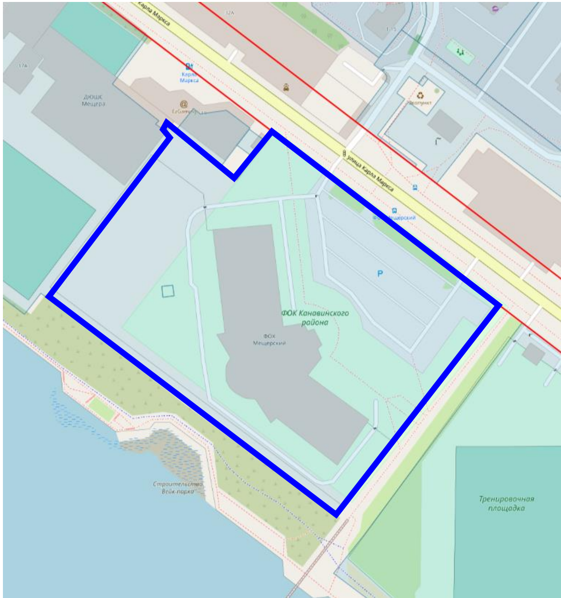
Схема границ подготовки документации по межеванию территории