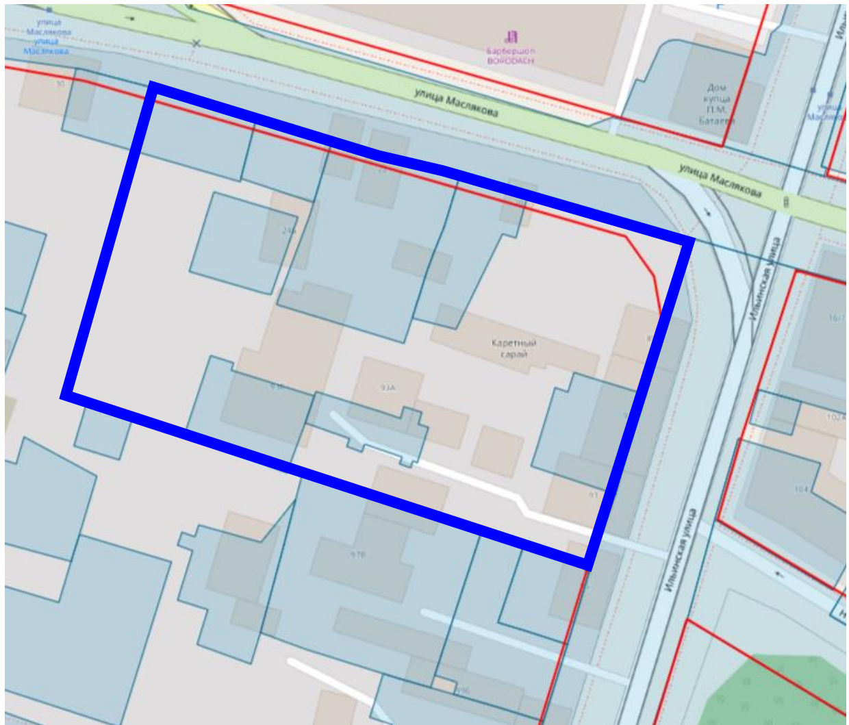
Схема границ подготовки документации по планировке территории