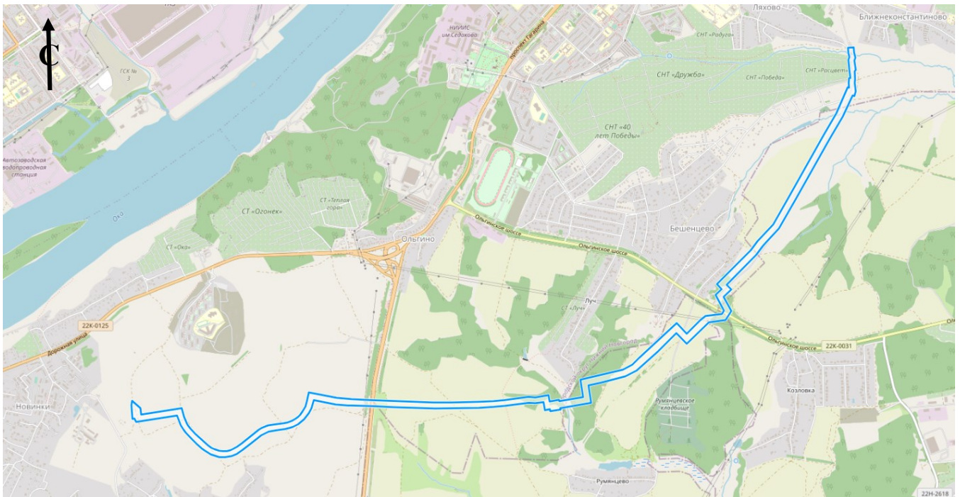
Схема границ подготовки документации по планировке территории (арх. № 195/22)