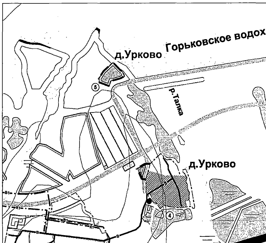
Фрагмент карты 8 «Карта развития объектов и сетей инженерно-технического обеспечения (водоснабжение и канализация)»