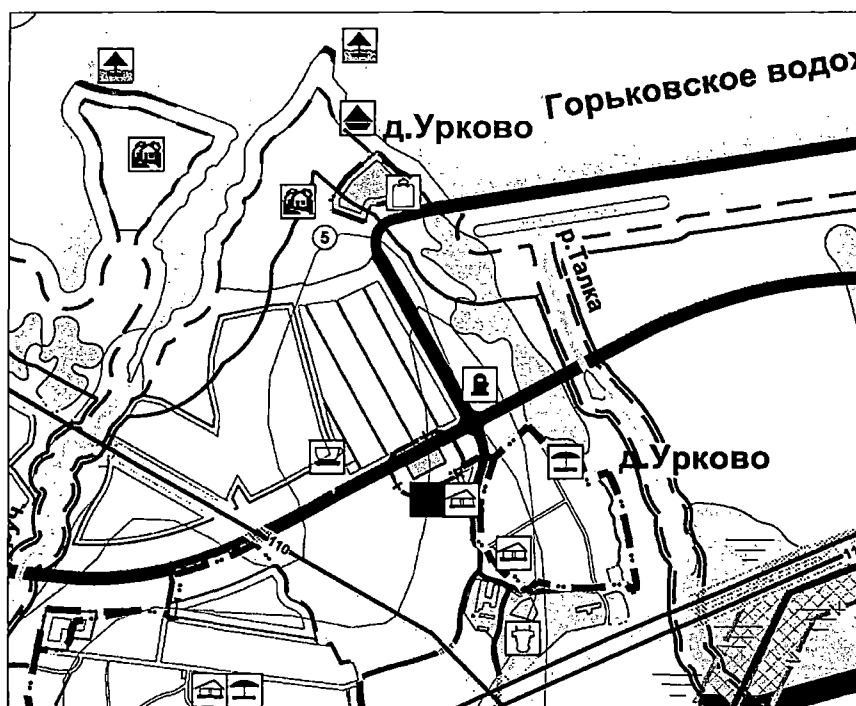
Фрагмент карты 7 «Карта развития объектов социальной инфраструктуры»