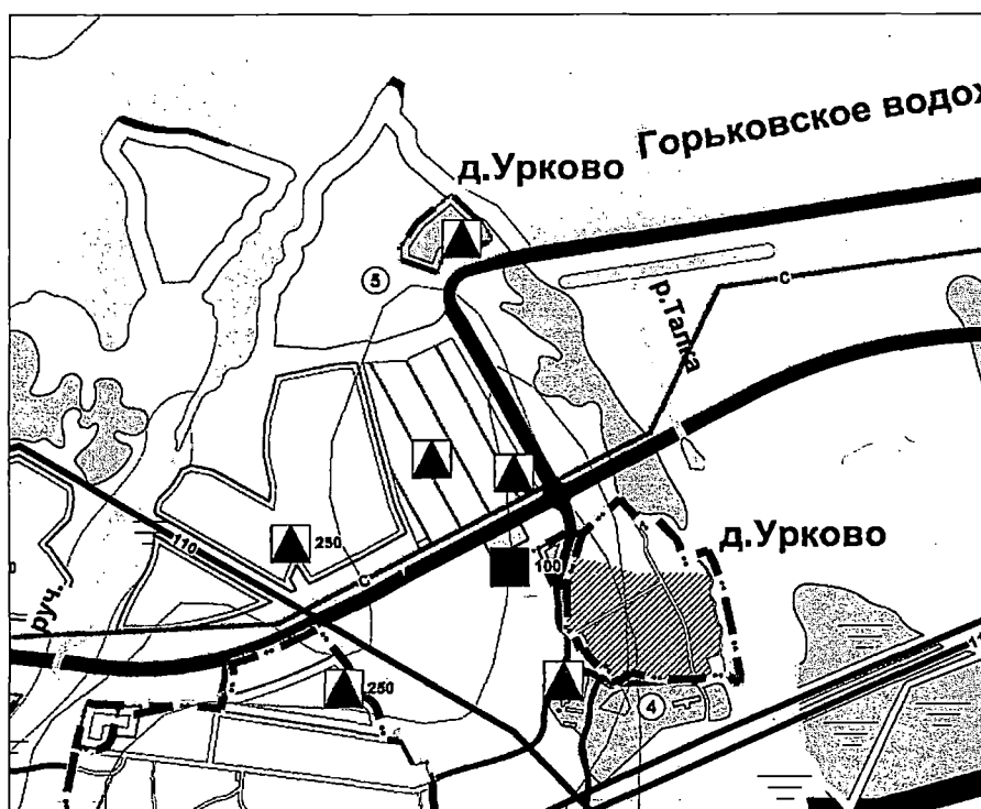
Фрагмент карты 10 «Карта развития объектов и сетей инженерно-технического обеспечения (электроснабжение и связь)»