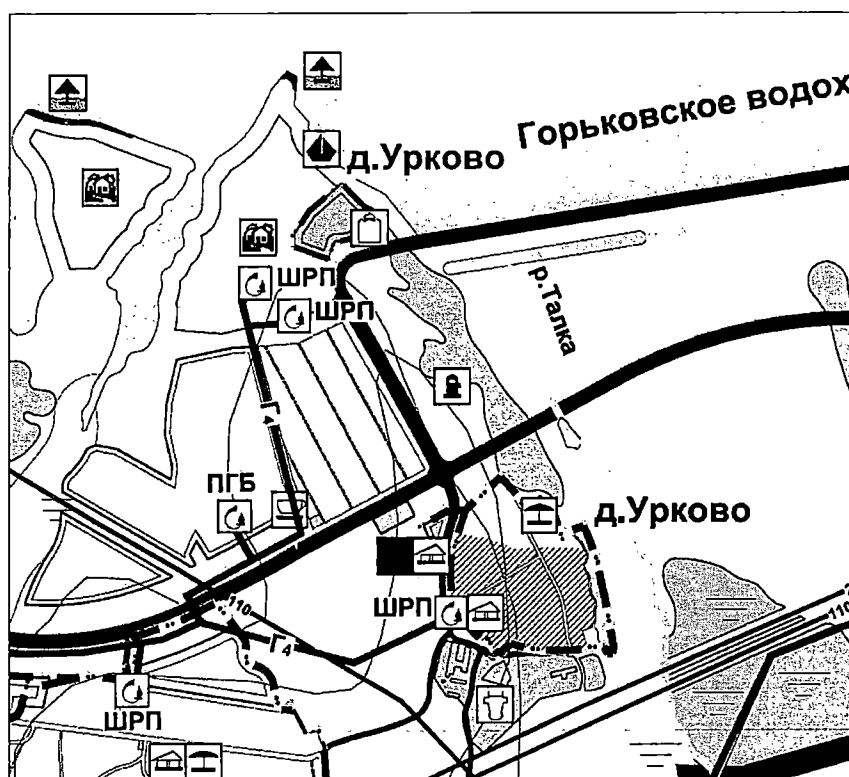
Фрагмент карты 9 «Карта развития объектов и сетей инженерно-технического обеспечения (теплогазоснабжения)»