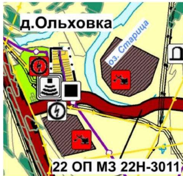
Фрагмент карты «Карта 1. Сводная карта (основной чертеж) территории городского округа»

к изменениям в генеральный план городского округа Навашинский Нижегородской области, утвержденный постановлением Правительства Нижегородской области от 6 декабря 2019 г. № 930