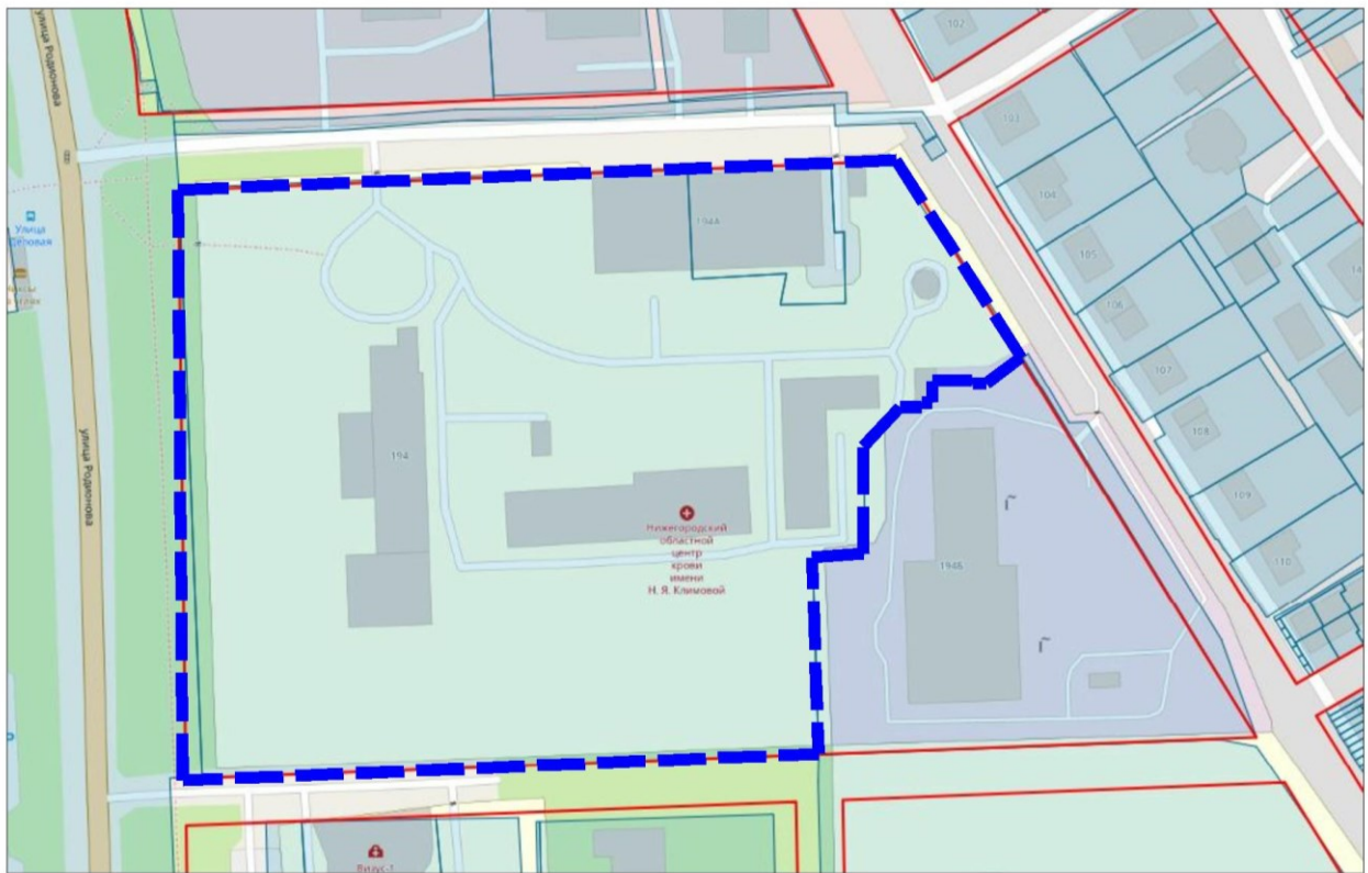
Схема границ подготовки документации по планировке территории