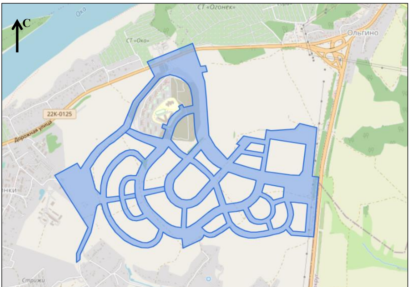
Схема границ подготовки документации по планировке территории (арх. № 51/23)

«ПРИЛОЖЕНИЕ к приказу министерства градостроительной деятельности и развития агломераций Нижегородской области от 10 ноября 2022 г. № 06-01-02/70