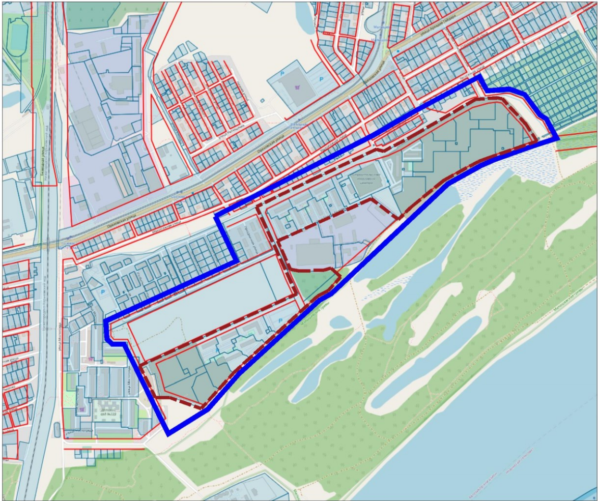
Схема границ подготовки документации по планировке территории