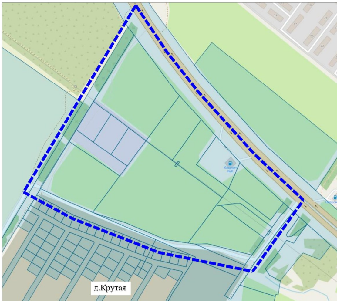
Схема границ подготовки документации по планировке территории