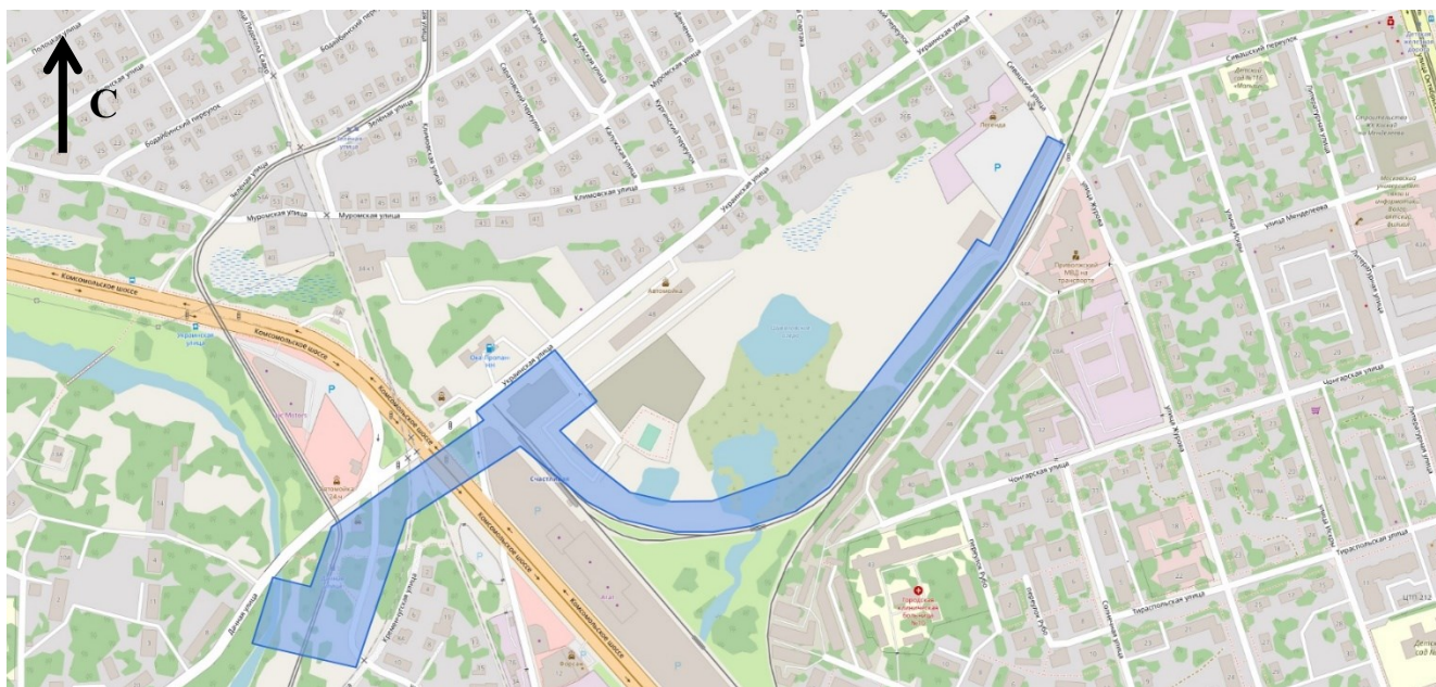
Схема границ подготовки документации по планировке территории (арх. № 85/22)