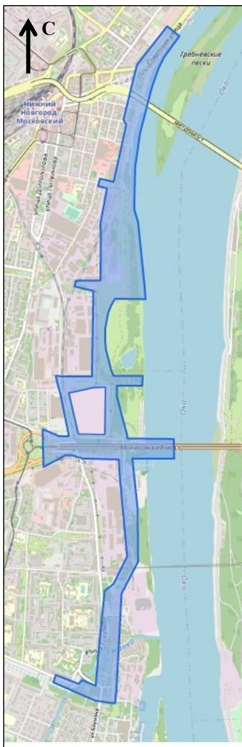
Схема границ подготовки документации по планировке территории (арх. № 104/23)