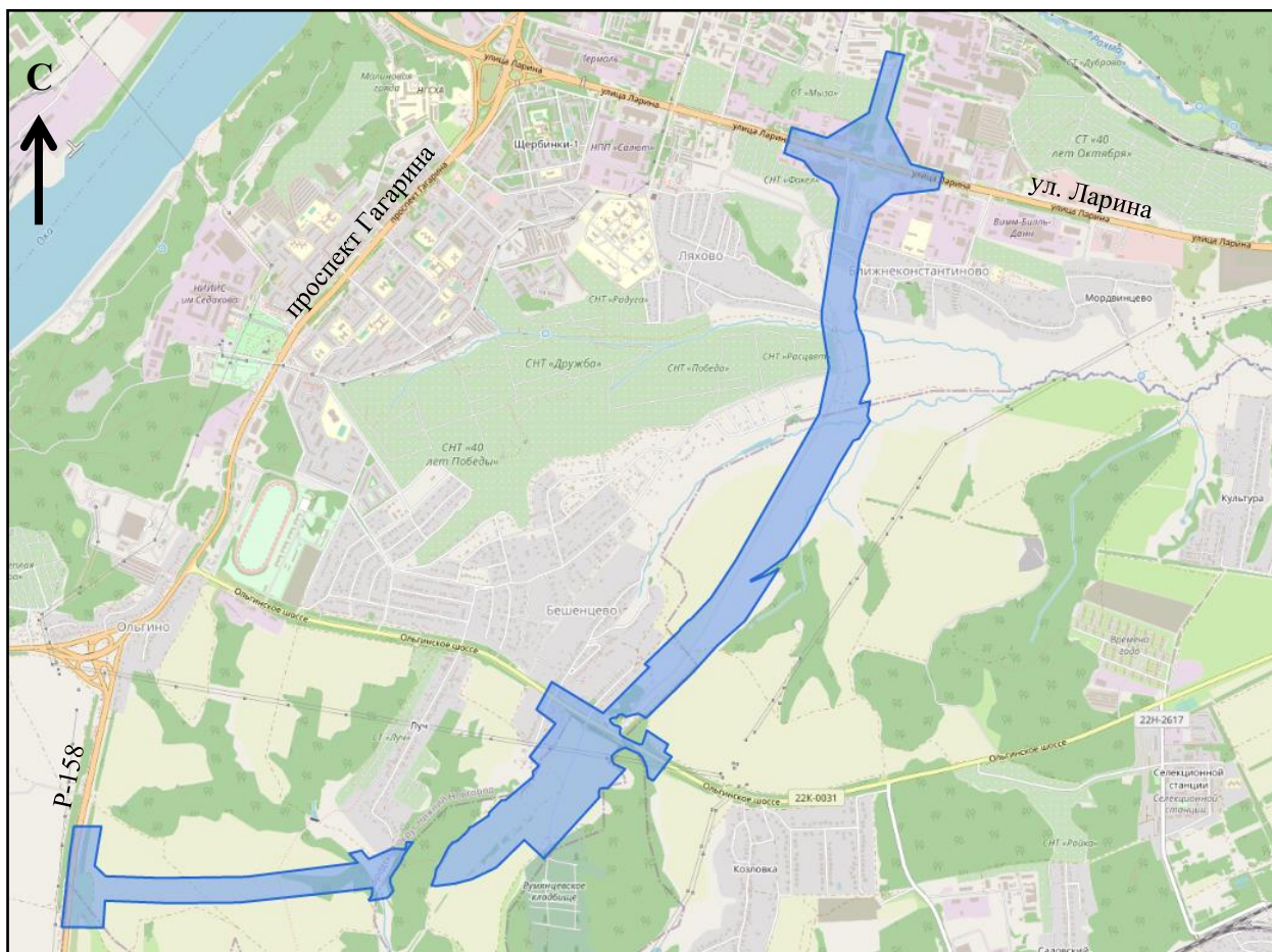
Схема границ подготовки проекта межевания территории на землях, не относящихся к землям лесного фонда (арх. № 117/23)