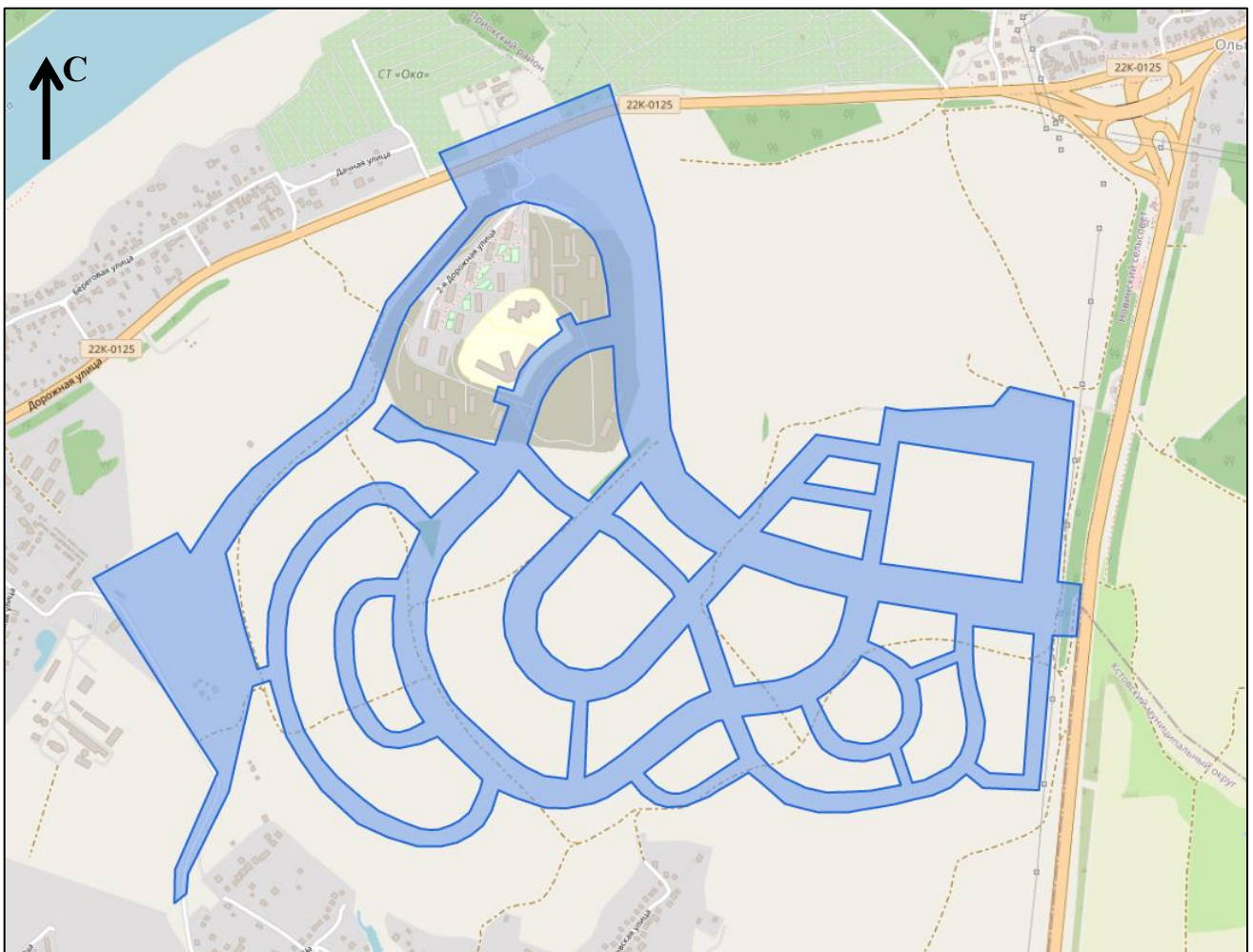
Схема границ подготовки документации по планировке территории (арх. № 51/23)

«ПРИЛОЖЕНИЕ к приказу министерства градостроительной деятельности и развития агломераций Нижегородской области от 10 ноября 2022 г. № 06-01-02/70