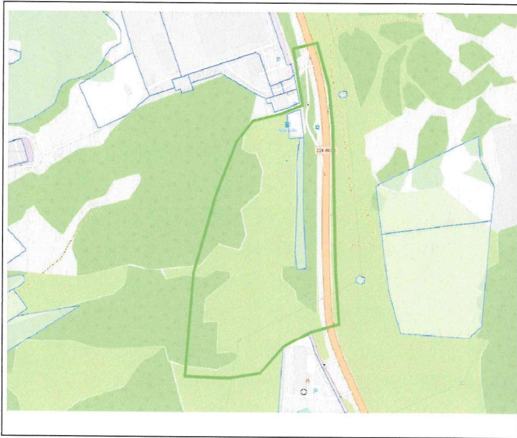
Схема границ подготовки инженерных изысканий