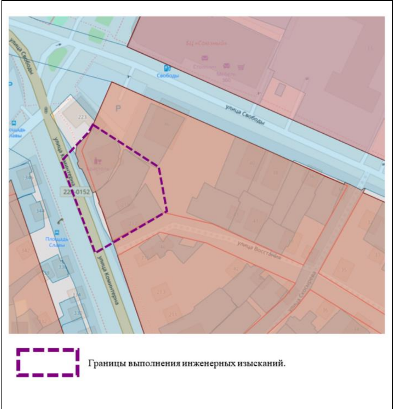
Схема границ подготовки инженерных изысканий