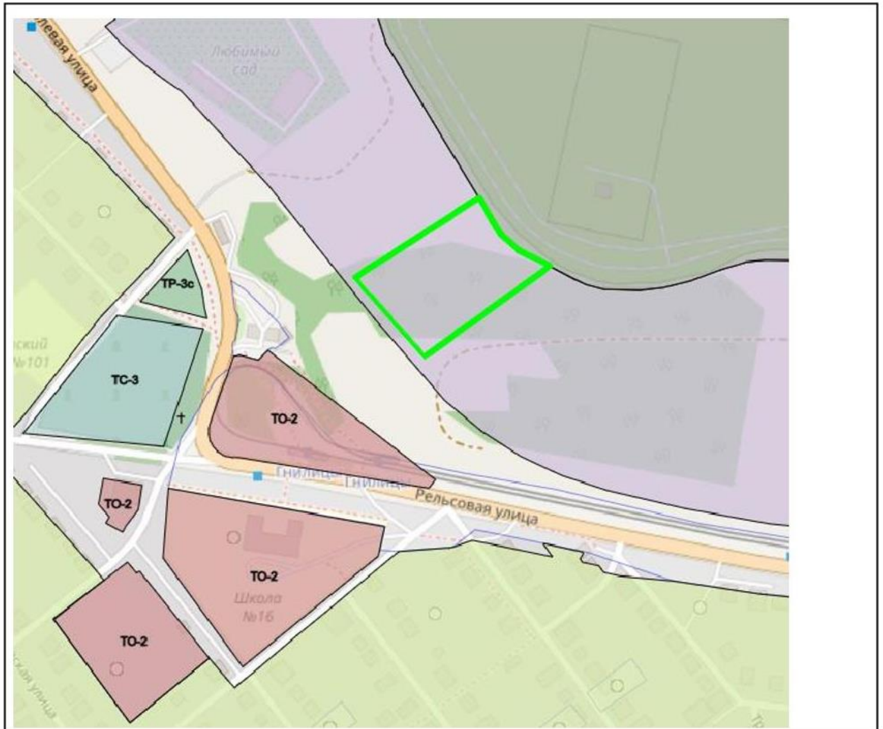
Схема границ подготовки инженерных изысканий